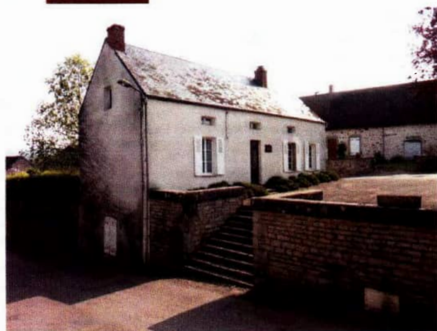
La maison natale d'Antonin Bondat à Montreuillon

La commune de Montreuillon, où le granit du Morvan affleure, s'étire dans deux directions : le long de l'Yonne, qui coule dans la vallée, enjambée au moyen d'un aqueduc magistral à l'entrée du village par un canal, connu sous le nom de "rigole d'Yonne", (sa fonction étant d'alimenter, loin en aval, le canal du Nivernais) ; perpendiculairement à la rivière, la rue principale du village monte résolument jusqu'à son point culminant, marqué par une imposante église. C'est au pied de cette église que se trouve la maison natale d'Antonin Bondat. Elle est aujourd'hui ornée d'une plaque commémorative, et la place de l'Église s'appelle dorénavant la place Jean Séverin.